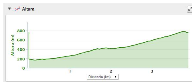
Perfil de la prueba.

Enlace Garmin: https://connect.garmin.com/modern/activity/553804117