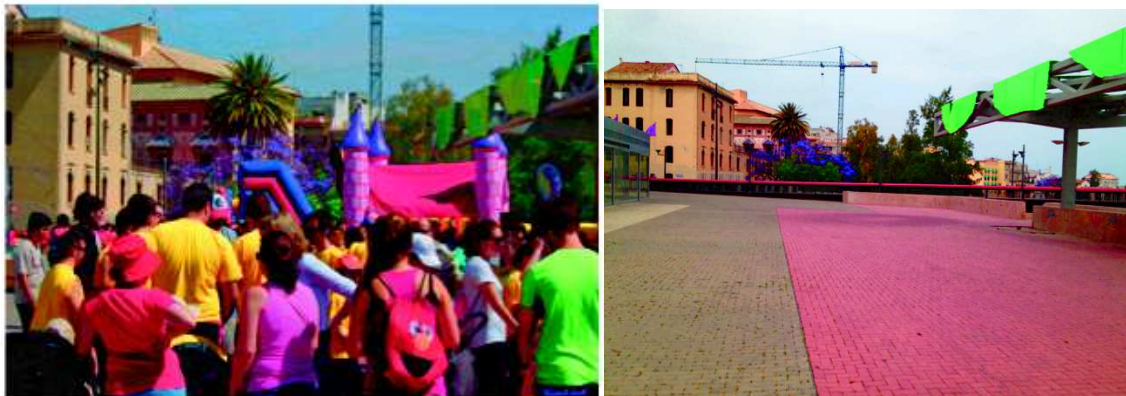
Ilustración 2 : PLAZA DEL TIRANT

Tenemos espacio suficiente para poder instalarnos correctamente, así como estar cerca de amplias zonas de Parking.