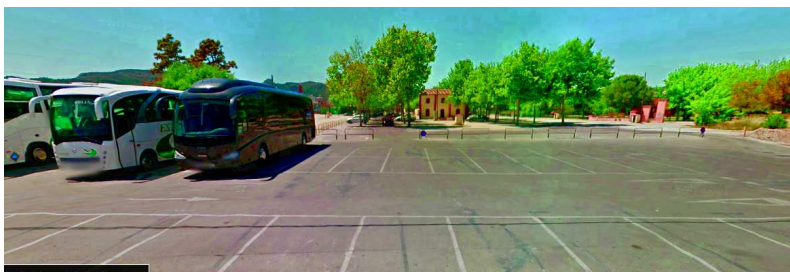
Ilustración 3: Aparcamiento situado en Avda. Villalonga, 20. Parking Zona Feria

La plaza del Tirant está a apenas 100 metros de amplias zonas de aparcamiento Público, donde tradicionalmente se sitúa la Feria de Gandía o los Mercadillos de los sábados.