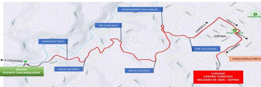
PRIMERA VUELTA AL SUR DE NARIÑO - PRIMERA ETAPA C.R.I. PUENTE DE CUALANQUIZÁN - YEE CUNCHILA - SECTOR LOS SAUCES - CENTRO TURÍSTICO MILAGRO DE DIOS - OSPINA VIERNES 17 DE MAYO 2024 2:00 p.m. -- LONGITUD 4.70 Km

Zonas de Abastecimiento Pie en Tierra: No la hay