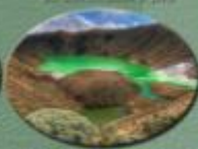
Alcalde de Timperres