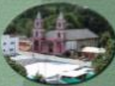
Alcalde de Mallama