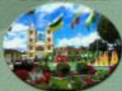
Alcalde de Ospina